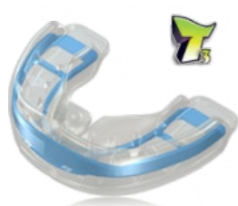
további fogívfejlesztés individuális fogpozicionálás