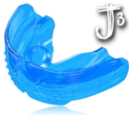
végző szabályozás retenció