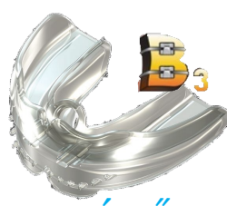
végző szabályozás retenció