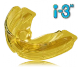
végző szabályozás retenció