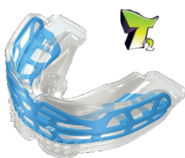
fogívfejlesztés állkapocs- pozicionálás