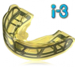
fogívfejlesztés állkapocs- pozicionálás