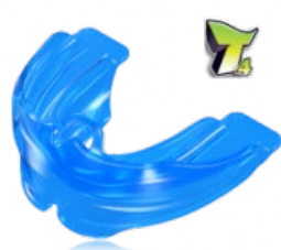
végző szabályozás retenció