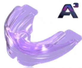
végző szabályozás retenció