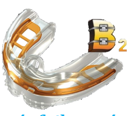
fogívfejlesztés állkapocs- pozicionálás