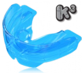
végző szabályozás retenció