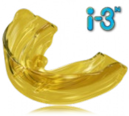
Kései tej- és korai vegyes fogazatban